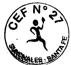
Psic. SILVINA LUCATO DIRECTORA C.E.F. N° 27 SUNCHALES

Esperando contar con su predisposición para el análisis y sentido común, teniendo en cuenta la presencia de una institución educativa por donde circulan grupos de 300 alumnos cada 45 minutos, de lunes a jueves esencialmente, lo saludo muy atte: